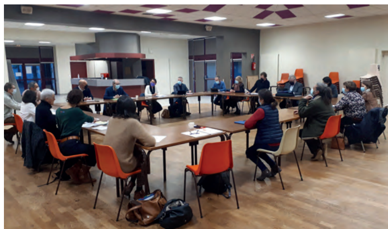
Visite de la commission d'habilitation

Des retombées positives sont également attendues en matière de lien social (mobilité solidaire, services parents/enfants, ateliers,...) et de retombées économiques générées par les activités et l'augmentation du pouvoir d'achat des personnes embauchées.