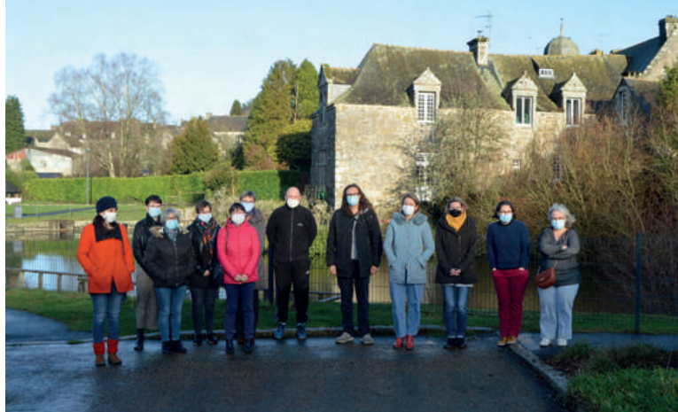
Des agent-es recenseur-euses en formation

Les résultats sont utilisés comme référence pour adapter la participation financière de l'État au budget des communes (plus une commune est peuplée, plus cette participation est importante). Ils permettent également d'ajuster l'action publique en matière d'équipements collectifs.